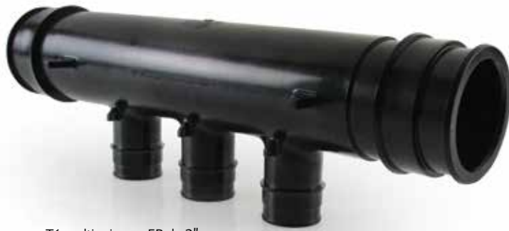
Té multivoies en EP de 2"