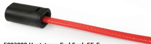
5993000 Heat-trace End Seal, SF-E