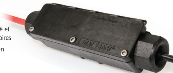
5992000 Bloc d'alimentation pour câble chauffant, SF-P