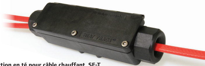
5994000 Jonction en té pour câble chauffant, SF-T

Uponor inc. 5925 148th Street West Apple Valley, MN 55124 USA Tél. : 800-321-4739 Télé. : 952-891-2008