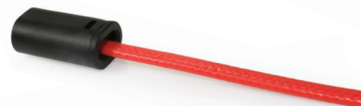
5993000 Obturateur pour câble chauffant, SF-E