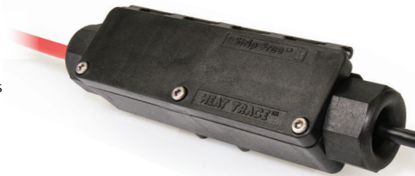
5992000 Heat-trace Power Supply, SF-P